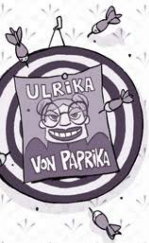
ULRIKA VON PAPRIKA