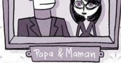
Papa & Maman