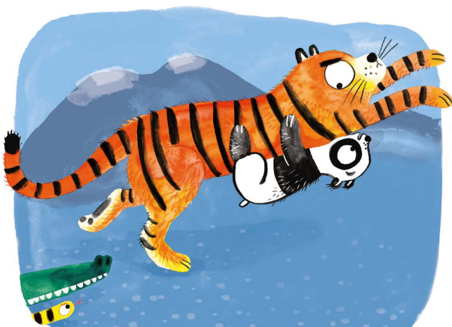
Abrazar a un tigre