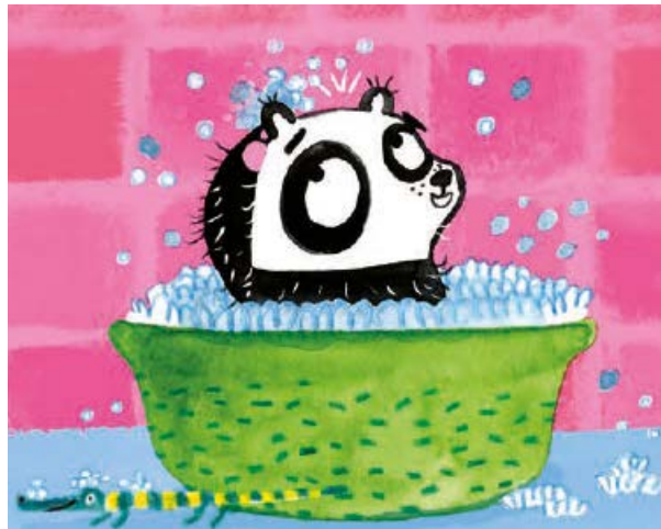
Darse un baño