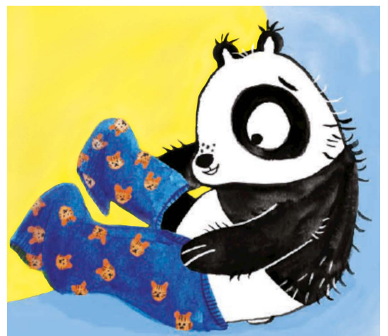
Ponerse el pijama